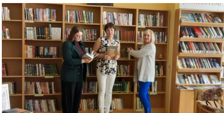
12-1. Feimaņu pagasta bibliotēkas abonementā

- Vizitācijas Maltas apvienības Ozolaines, Maltas, Silmalas un Feimaņu pagasta bibliotēkās 26. maijā kopā ar Reģiona galvenās bibliotēkas direktori un KTP vadītājas vietnieci. Mērķis: bibliotēku dokumentācijas un akreditācijas komisijas ieteikumu izpildes pārraudzība. ( skat. attēlus 12-1.; 12-2. )