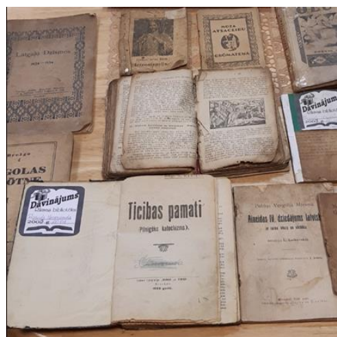
6-6. Novadpētniecības krājuma grāmatu izstāde Rikavas pagasta bibliotēkā