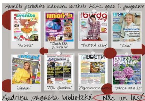
6-3. Seriālizdevumu virtuālā izstāde