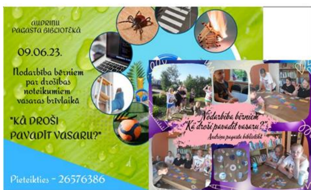
7-3. “Kā droši pavadīt vasaru?”