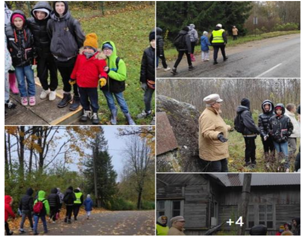
7-22. "Pastaiga pa Dricānu personību dzīves un darba vietām"