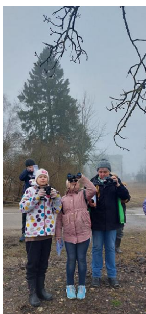
7-26. Putnu vērošana

Mākoņkalna pagasta bibliotēkas sadarbības partneri darbā ar bērniem un jauniem Brīvā laika pavadīšanas centrs “Strops” un Rāznes nacionālā parka izglītības centrs . Putnu dienas 2023 Makoņkalna pagastā! Putnu dienām veltītā aktivitāte Rāznes Nacionālā parka dabas centrā - informatīva lekcija, meistarklase par putnu būrīšu izgatavošanu, uzdevumi, putnu vērošana. (skat. attēlus 7-26.; 7-27.)