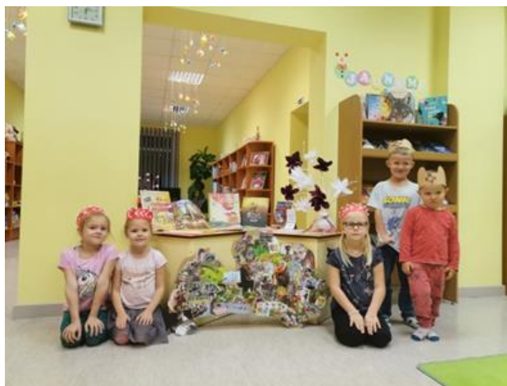
7-5. “Pasaku skola”

lasītveicināšanas aktivitāte Maltas pagasta bibliotēkā