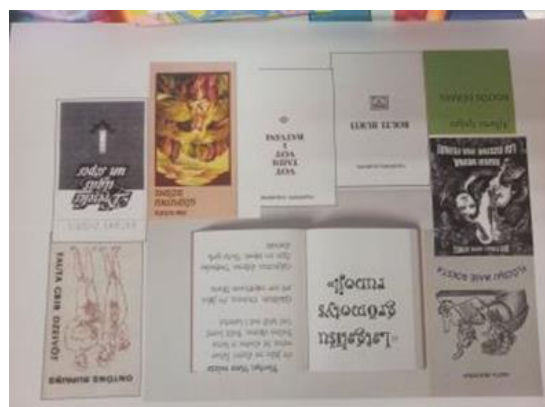
8-4. “Seno grāmatu un rokrakstu izstāde”

Lielu apmeklētāju interesi izraisīja seno grāmatu izstāde norisē “Latviešu grāmatai 500” Feimaņu pagasta bibliotēkā . Šajā izstādē tika savāktas dažādas senās grāmatas , vecākā no kurām bija datēta ar 1900. gadu, rokraksti, piemēram Pilsoņu kara karavīra dziesmu burtnīca, mācību grāmatas, grāmatas ar dāvinātāju ierakstiem, 20. gs. žurnāli.