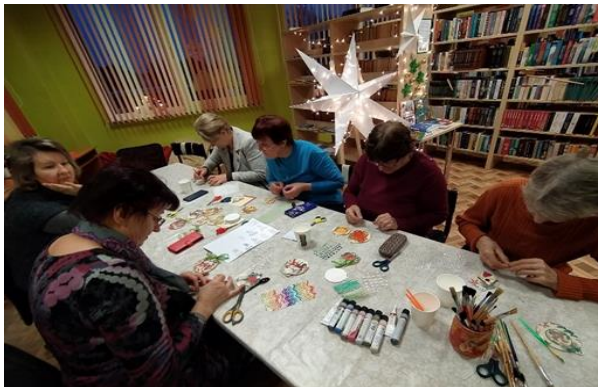
11-8. Radošā darbnīca Bērzgales pagasta bibliotēkā