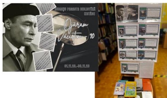
6-2. “Novembra jubilāram – latviešu dzejniekam Ojāram Vācietim - 90”. Izstāde Audriņu pagasta bibliotēkā