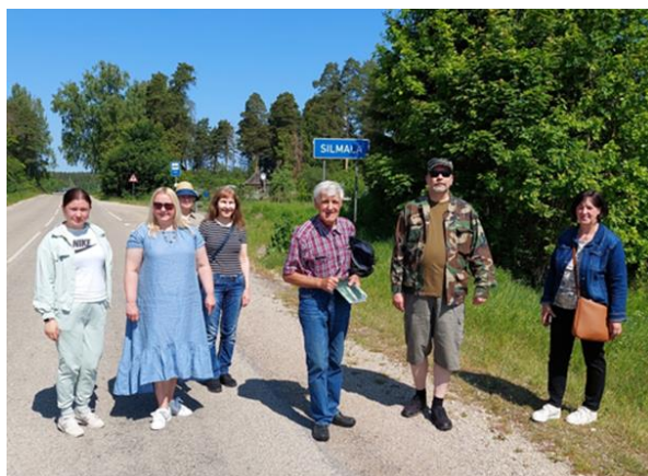
8-7. Novadpētnieku ceļojums pa Silmalas pagastu