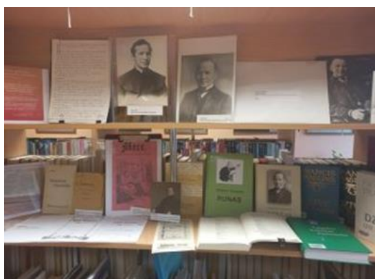
8-3. Literatūras izstāde “Franča Trasuna dzīve un devums Latgalei”

Sakstagala pagasta bibliotēkas novadpētniecības izstāžu plauktā tika veidotas izstādes: “Atmiņās barikāžu laiks”, “Represēto vējos aizsauktie”, “Seno grāmatu un rokrakstu izstāde, ”Franča Trasuna dzīve un devums Latgalei, “Sakoptākā pagasta māja” - pagasts fotogrāfijās. ( skat. attēlus 8-3., 8-4. )