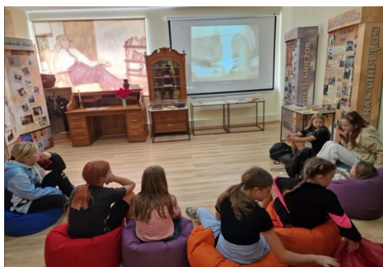
7-23. Dzejas diena Bērzgales Antona Rupaiņa muzejā

Bērzgales pagasta bibliotēkas, jauniešu centra “Baterija” un Antona Rupaiņa muzejā Dzejas dienas norises muzejā. (skat. attēlu 7-23.)