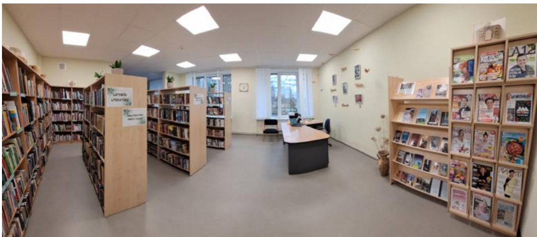
3-2. Bibliotēkas abonements