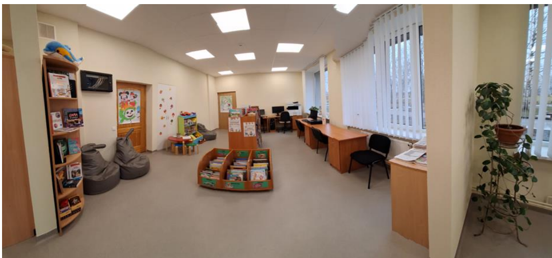
3-3. Bērnu zona un datortelpa