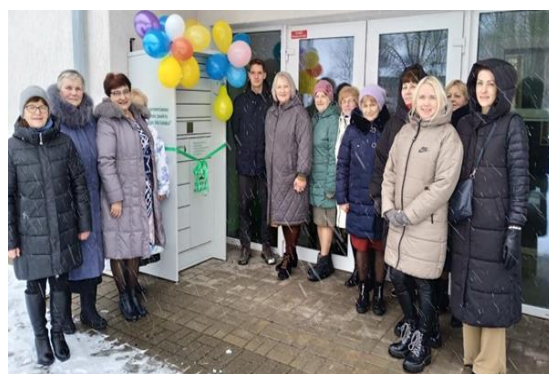
5-2. Bibliomāta atvēršana pie Viļānu pilsētas bibliotēkas