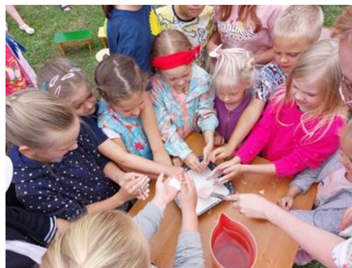
7-4. “Eksperimenti svaigā gaisā”

Aktivitāšu pēcpusdiena “Eksperimenti svaigā gaisā” tika organizēta Maltas pagasta bibliotēkas pagalmā. Bērni saistošā veidā uzzināja par dažādām dabas parādībām un procesiem un paši tos izjuta, aktīvi piedaloties piedāvātajos eksperimentos. (skat. attēlu 7-4.)