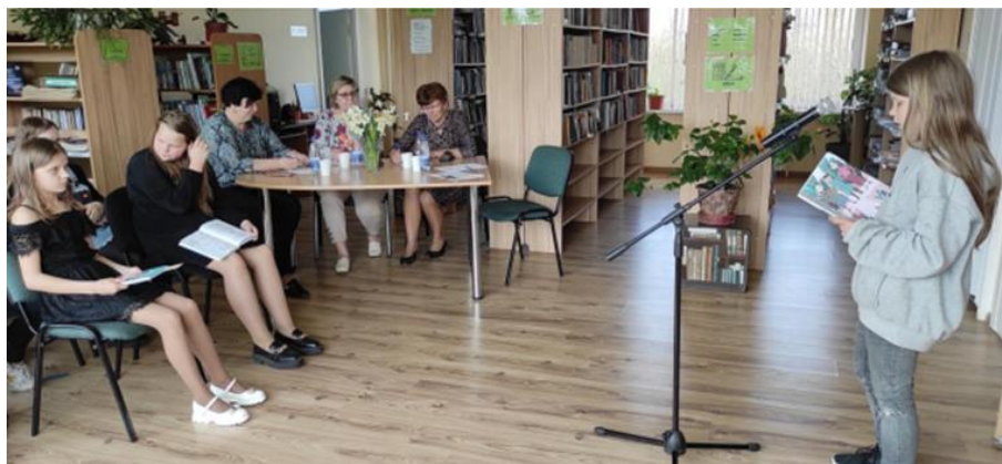
7-19. Konkursa pirmais posms Dricānu pagasta bibliotēkā

Nozīmīga aktivitāte, kuru bibliotēka veic ciešā sadarbībā ar skolu (skolotājiem) ir Nacionālās skaļās lasīšanas sacensība . Pirmā konkursa kārtā tika organizēta Dricānu, Feimaņu, Kaunatas, Maltas pagasta un Viļānu pilsētas bibliotēkā. Visas bibliotēkas, kas organizēja pirmo atlases kārtu, piedalījās otrajā kārtā reģiona līmenī Rēzeknes Centrālajā bibliotēkā.