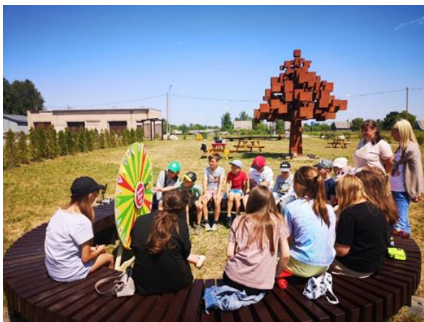
10-4. Bibliotēkas draugu pikniks