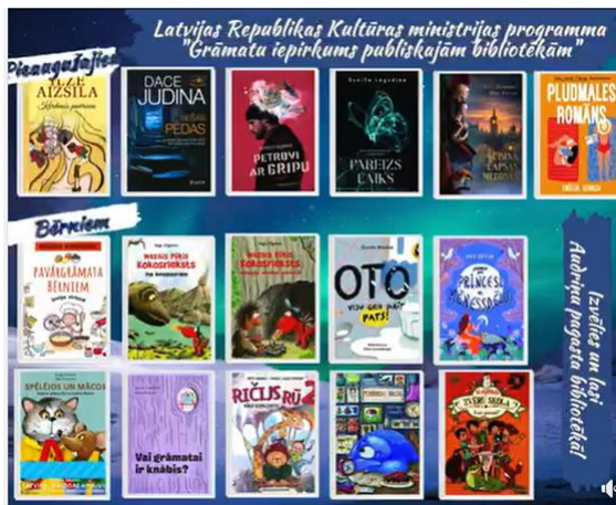
6-7. Virtuāla izstāde sociālajos medijos