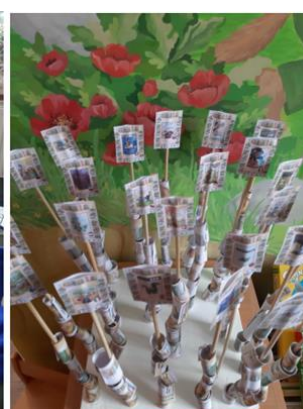
“Eiropas Rakstnieku dienas” pasākums - spēle “Reiz bija...”