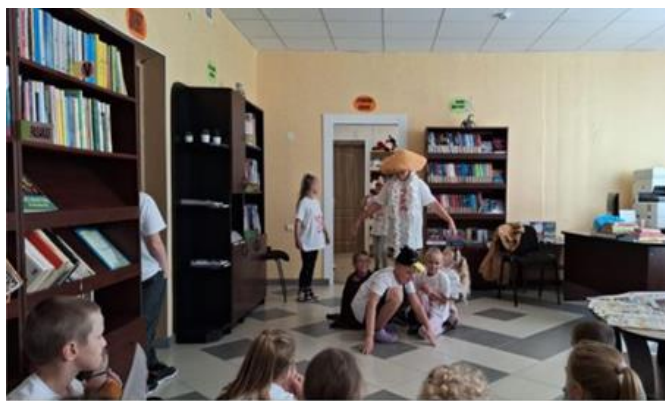
7-9. Bērnu vasaras nometnes "Domā. Dari. Radi." Dalībnieki Stružānu pagasta bibliotēkā

Stružānu pagasta bibliotēkā 25.augustā viesojās bērnu nometnes "Domā. Dari. Radi." dalībnieki - Dricānu vidusskolas 1.- 4. klases skolēni kopā ar skolotājām. Dalībnieki veica pētījumu par grāmatām, klausījās pasaku un iestudēja ludziņu "Zem sēnītes." (skat. attēlu 7-9.)