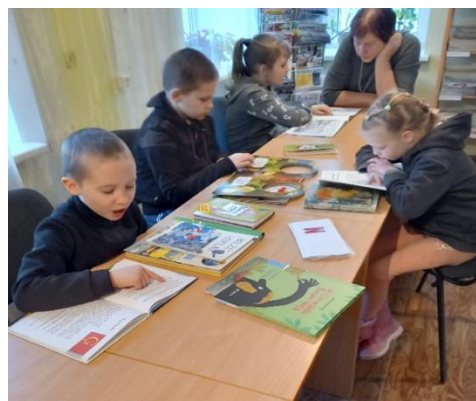
7-10. „Lasām, minam daudz jauna uzzinām” Stoļerovas pagasta bibliotēkā

Uz tematisku pasākumu „Lasām, minam daudz jauna uzzinām” Stoļerovas pagasta bibliotēkā tika aicināti Rēznas pamatskolas 3. klases skolēni. Kopā tika lasītas jautras, izzinošas grāmatiņas, minētas mīklas. (skat. attēlu 7-10.)