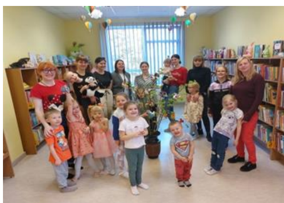
5-5. “Tikšanās vieta – bibliotēka!”

“Tikšanās vieta – bibliotēka!” ar tādu nosaukumu Bibliotēku nedēļā notika radošā aktivitāte ģimenēm Maltas pagasta bibliotēkā . Kopā sanāca, kopā bija, kopā līdzdarbojās un kopā svinēja dažādu paaudžu maltieši, apliecinot bibliotēkas nenovērtējamo nozīmi vietējās kopienas iesaistīšanā, attīstībā un saliedēšanā. (skat. attēlu 5-5.)