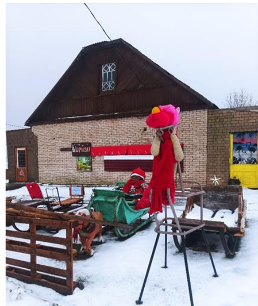
8-10. Brīvdabas izstāde “Ragavas” Mākoņkalna pagasta Lipuškos

Otrā izstāde “ Zirgu pajūga ragavas cauri laikiem... ” tika piedāvāta apskatei decembrī. To arī apskatīja prāvs skaits garāmbraucēju un citu interesentu. (skat. attēlu 8-10.)