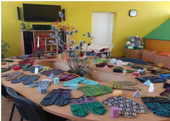
11-4. . Latviešu rakstaino cimdu izstāde Dekšāres pagasta bibliotēkā