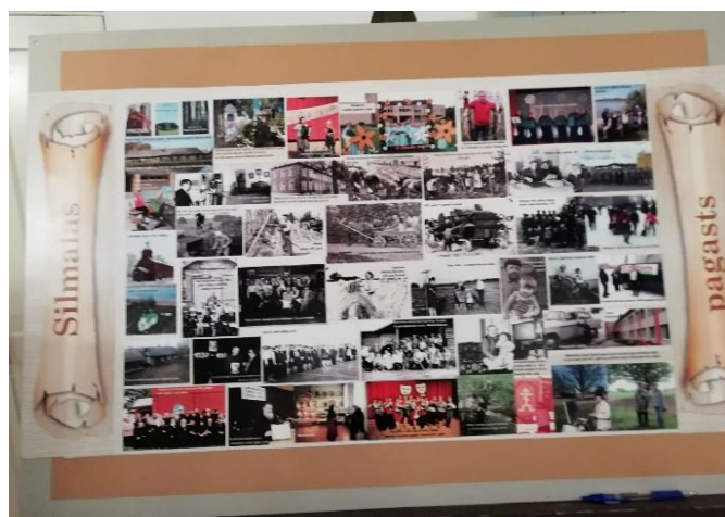
8-5. Fotokonkursa “Fotogrāfijas – laika liecinieces” Simalas pagasta baneris

18.februārī Maltas Kultūras namā notika fotokonkursa “Fotogrāfijas – laika liecinieces” noslēguma pasākums. Konkurss bija unikāls gan ar apzīmējumu “draudzīgas sacensības”, gan ar to, ka vien mēneša laikā tika iesūtītas 965 bildes, kas raksturo dzīvi Maltas, Simalas, Ozolaines, Feimaņu, Pušas un Lūznavas pagastā gan senatnē, gan jau mūslaikos. Rezultāts bija ceļojoša fotoizstāde, kuru pēc kārtas varēja apskatīt katrā pagastā .