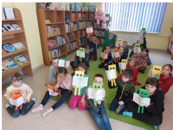
7-28. “Māja, kur dzīvo grāmatas” – Maltas pagasta bibliotēka

Sadarbībā ar Rēzeknes novada speciālo pamatskolu Maltas pagasta bibliotēkā regulāri notiek skolas audzēkņu radošo darbu izstādes („Degunainīši”), kā arī tematiskās rīta stundas “Māja, kur dzīvo grāmatas.”