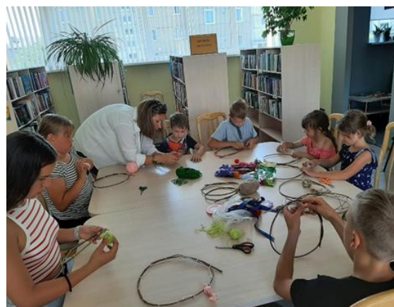
7-25. BIBLIOVASARA 2023 Kaunatas pagasta bibliotēkā

Mākoņkalna pagasta bibliotēkas sadarbības partneri darbā ar bērniem un jauniem Brīvā laika pavadīšanas centrs “Strops” un Rāznes nacionālā parka izglītības centrs . Putnu dienas 2023 Makoņkalna pagastā! Putnu dienām veltītā aktivitāte Rāznes Nacionālā parka dabas centrā - informatīva lekcija, meistarklase par putnu būrīšu izgatavošanu, uzdevumi, putnu vērošana. (skat. attēlus 7-26.; 7-27.)