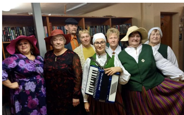
5-4. "Vokors latgalīšu gaumē" Čornajas pagasta bibliotēkas Rāznas nodaļā

Jaunu bibliotēkas lietotāju piesaistei tiek organizēti tematiski pasākumi, kad uz bibliotēku atnāk arī "nelasītāji" un, apskatot bibliotēkas piedāvājumu klātienē, dažkārt maina savu viedokli.