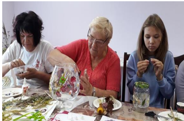
11-9. Radošā darbnīca Viļānu pilsētas bibliotēkā