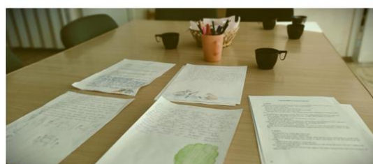
7-11. “Rakstnieks man blakus” Dricānu pagasta bibliotēkā