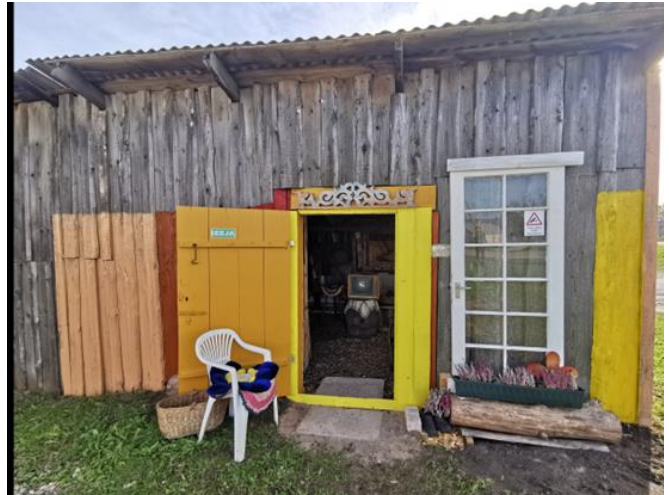
8-9. Brīvdabas izstāde “Durvis Mākoņkalna pagasta Lipuškos