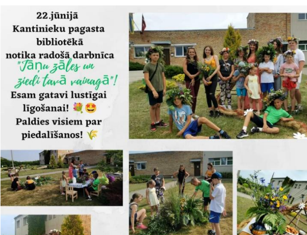
7-12. Līgo svētku darbnīca Kantinieku pagasta bibliotēkā “Jāņu zāles un ziedi tavā vainagā!”