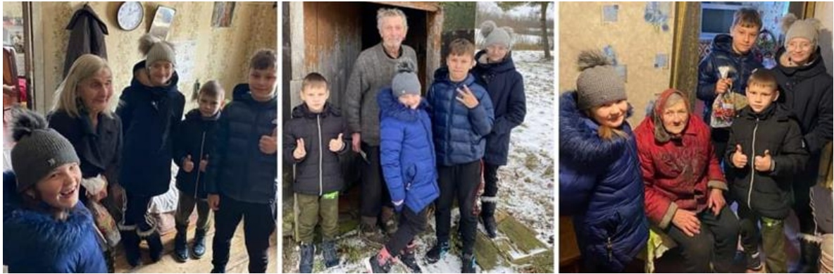
11-3. Vientuļo veco cilvēku sveikšana mājās