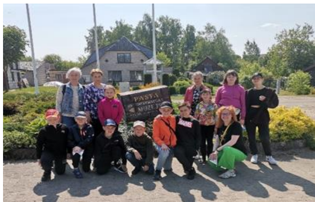
7-16. Maltas BJVŽ dalībnieku izziņošanas ekskursija uz Aglonu

Programmas ikgadējā lasīšanas posma noslēgumā dalībniekiem tiek sarīkoti pateicības pasākumi. (skat. attēlus 7-15.; 7-16.)