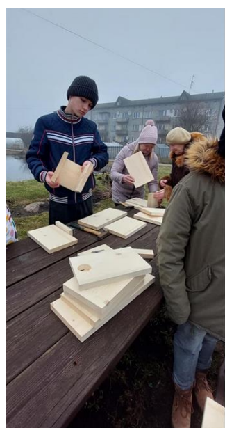
7-27. Putnu būrīšu izgatavošana