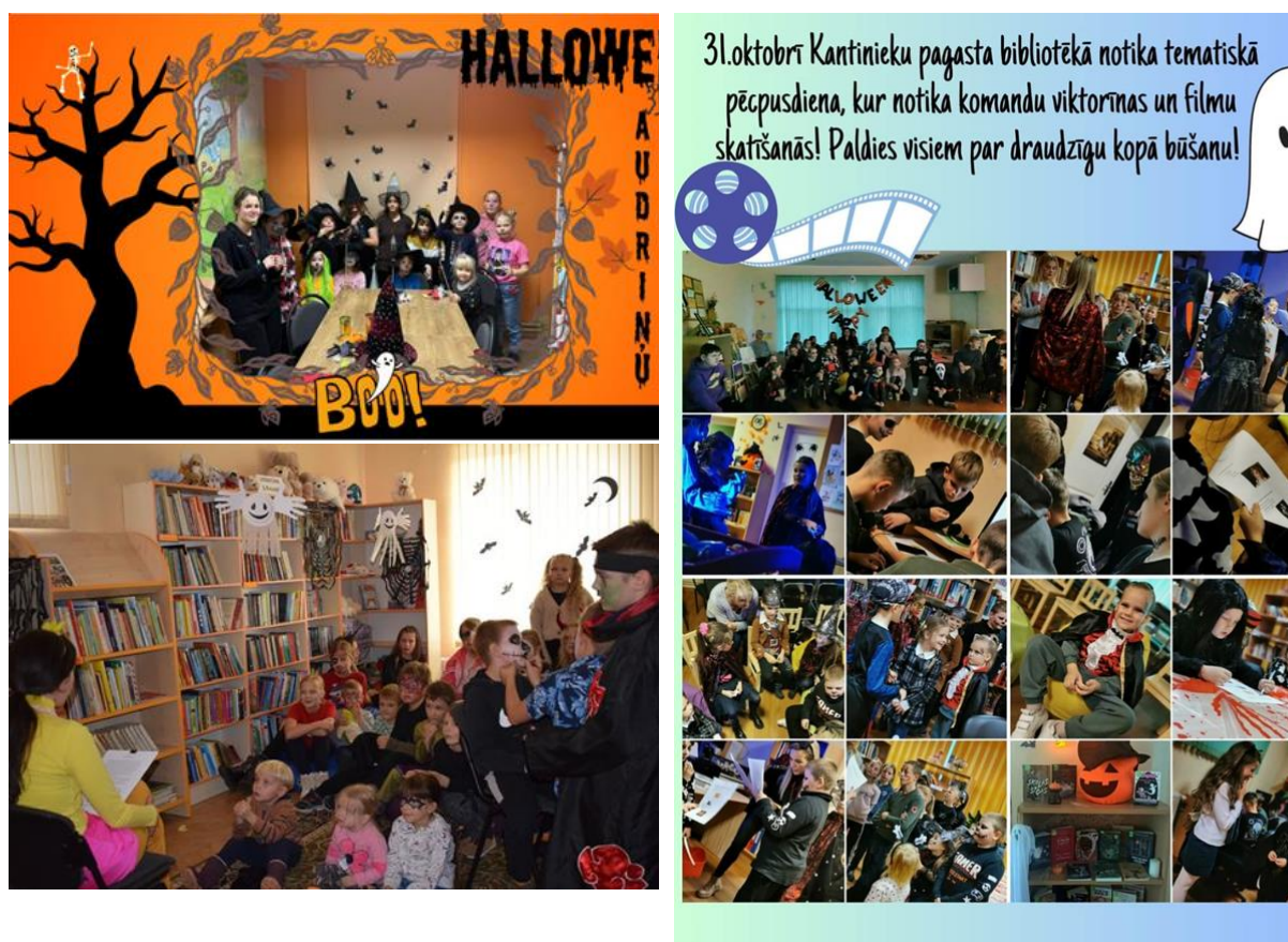
7-13. Helovīns Audriņu, Vērēmu un Kantinieku pagasta bibliotēkā

Uz Helovīna pasākumu “ Šausmu stāstu vakars ” Vērēmu pagasta bibliotēkā bērni ieradās spocīgās maskās un aksesuāros. Klausījās un paši stāstīja spoku stāstus, iesaistījās bibliotēkas saimnieču – raganas un melnās kaķenes – sagatavotā kvestā un spocīgi jocīgos pārbaudījumos. Aktivitātes atbalstīja un palīdzēja rīkošanā Jauniešu centra speciāliste.