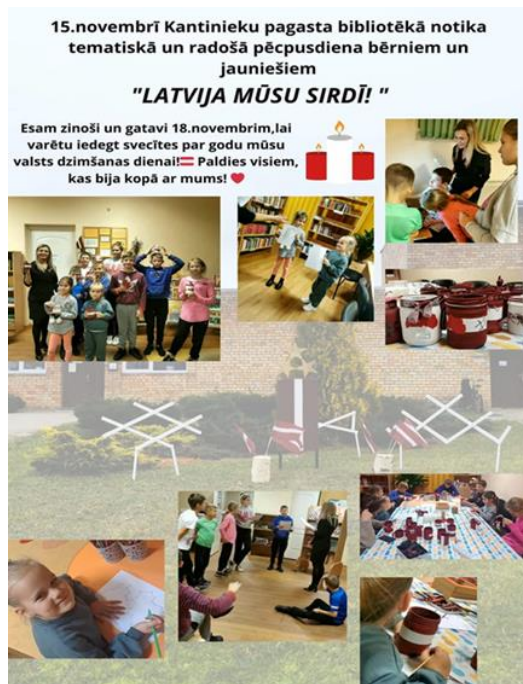
7-14. Radoša tematiska pēcpusdiena "Latvija mūsu sirdī!" Kantinieku pagasta bibliotēkā