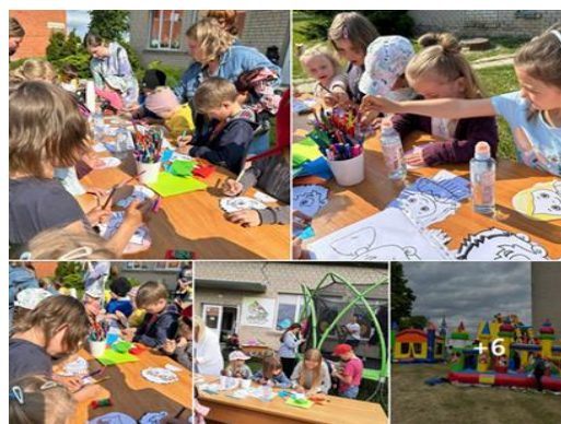
7-24. Bērnu aizsardzības dienas aktivitātes Kaunatā