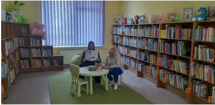
12-2. Maltas pagasta bibliotēkas bērnu literatūras nodaļā