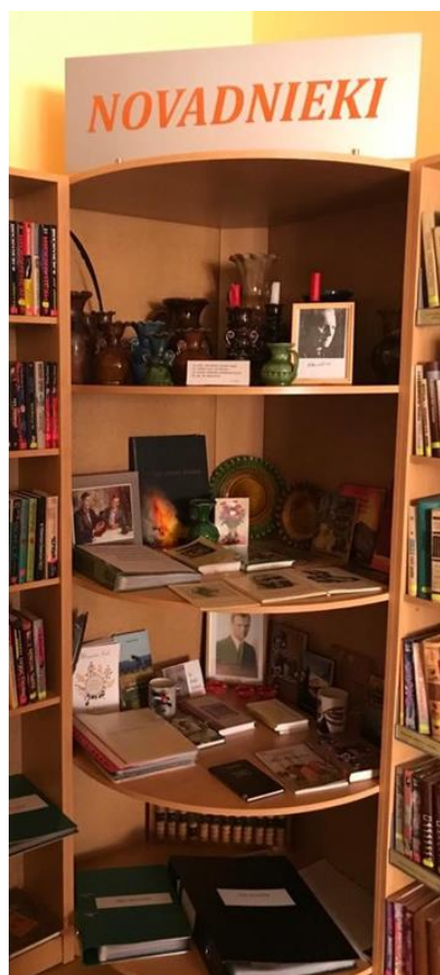
8-1. Novadpētniecības ekspozīcija Feimaņu pagasta bibliotēkā

Novadpētniecības krājums bibliotēkās parasti tiek izvietots redzamākā un pieejamākā vietā, kā arī dažās bibliotēkās ir izveidoti ļoti pievilcīgi gan vizuāli, gan eksponātu piedāvājumā novadpētniecības stūrīši. ( skat. attēlus 8-1.; 8-2. )