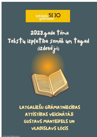
12-3. Plakāts par 2023. gada tēmu