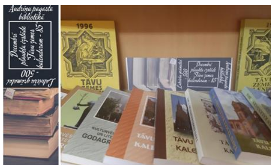
6-1. Norisē “Latviešu grāmatām 500”, izdevumu izstāde “Tāvu zemes kalendaram – 85” Audriņu pagasta bibliotēkā

Arvien biežāk bibliotēku darbinieki krājuma popularizēšanā iesaista lasītājus. Malta pagasta bibliotēkā tika izveidota jaunā rubrika “Maltieši iesaka!” Reizi mēnesī vietējie iedzīvotāji ieteica lasāmvielu, kas viņus ir uzrunājusi un ko viņi piedāvā izlasīt arī citiem. Par šo aktivitāti sociālo tīklu lietotāji katru mēnesi tika informēti arī Facebook profilā. Šo krājuma popularizēšanas rubriku ļoti atzinīgi novērtēja bibliotēkas apmeklētāji, bieži vien izvēloties ieteikto grāmatu.