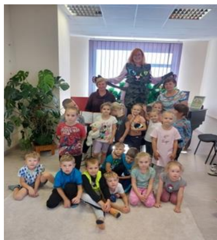
7-7. "Kāpēcīši bibliotēkā" lasītvēicināšanas aktivitāte sadarbībā ar PII "Dzīpariņš"