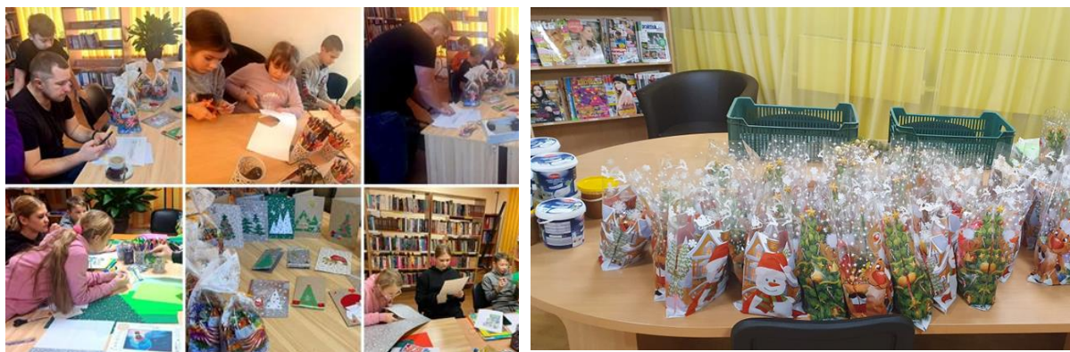
11-1. Apsveikuma kartiņu un dāvanu izgatavošana Kantiņieku pagasta bibliotēkā

Bibliotēkas atbalsta sociālās akcijas un piedalās dāvanu un apsveikumu sagatavošanā Ziemassvētkos savu pagastu vientuļajiem iedzīvotājiem. (skat. attēlus 11-1.; 11-2.; 11-3.)