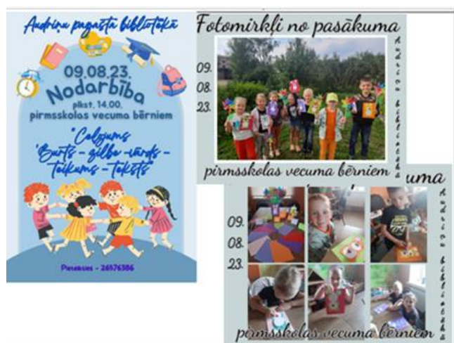
7-6. "Ceļojums "burts-zilbe-vārds-teikums-teksts" "

Nodarbībai bija vairāki posmi – iepazīšanās, mērķa paziņošana un izpildes process, sasniegšanas rezultāta apkopojums un analīze un, beidzot, nopelnīts cienasts. Sēžot pie galda, bērni ar aizrautību stāstīja par savu sapņu skolu, kuru viņi jau pavisam drīz sāks apmeklēt. Lai gan pagaidām tie ir tikai sapņi, cerēsim, ka tie piepildīsies, visi mūsu pirmsskolnieki kļūs par brašiem skolēniem un viņus sagaidīs atsaucīgi skolotāji un draudzīgi klasesbiedri! https://rezeknesnovads.lv/nodarbiba-pirmsskolas-vecuma-berniem-audrinu-biblioteka/