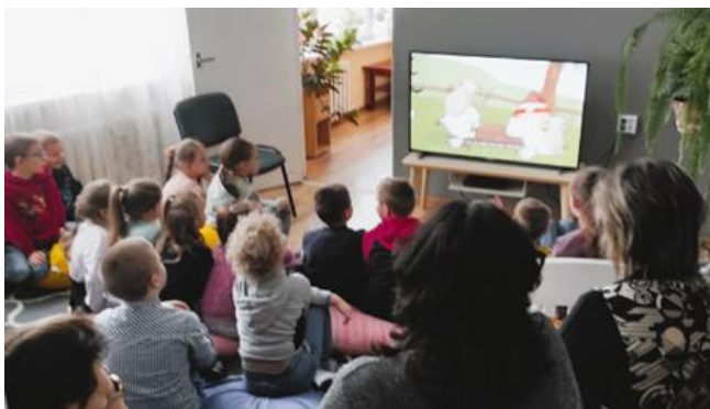
7-1. Drošāka interneta diena Dricānu pagasta bibliotēkā