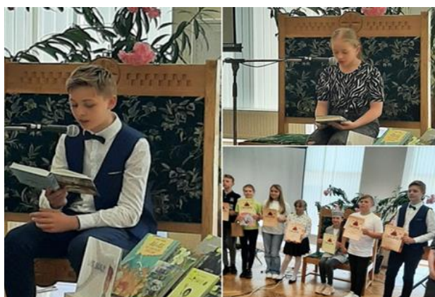
7-20. Kaunatas konkursanti reģionālajā finālā Rēzeknes Centrālajā bibliotēkā

Iepazīstināšanai ar bibliotēku, grāmatām un lasīšanas veicināšanai tika organizēta interaktīva nodarbība Gaigalavas pirmsskolas izglītības iestādes (PII) un sākumskolas skolēniem , kuri iepazīna pasakas nedaudz citādākā formātā – audio un video pasakas, jāpiemin, ka bērniem patika, dejoja, dziedāja līdz! Tika izmantoti Skola2030 piedāvātie mācību materiāli, šajā gadījumā tika izmantota Dinamisko paužu video sērija “ Laiks kustībai ” pirmsskolas un sākumskolas skolēniem. Ziemas mēnešos bērni pēc stundām nāca zīmēt, līmēt, griezt sniegpārslīņas un sacerēt savus dzejoļus. ( Gaigalavas pagasta bibliotēka )