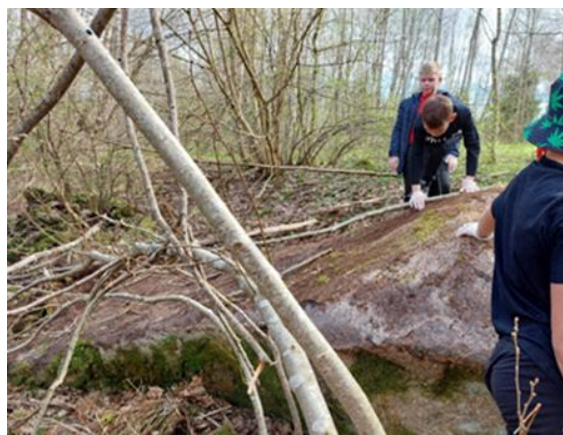
8-8. Jauniešu ekspedīcija pie dižākmens Čornajas pagasta

Čornajas pagasta bibliotēkās rīkotajā novadpētniecības ekspedīcijā kopā ar jauniešu klubu, jaunieši tika iesaistīti pagasta dižākmens meklēšanā . Dokumentos ir minēts, ka pagastā atrodas divi dižakmeņi. Viena atrašanās vieta ir zināma, bet otra vieta, nē. Tāpēc kopā ar jauniešiem tika nolemts to atrast. Un tas izdevās! Pēc veiksmīga atraduma, tika ceptas desīņas un pārrunāts par pagasta vēsturi. ( skat. attēlu 8-8. )