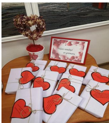
6-5. Lasīšanas akcija "Aklais randiņš ar grāmatu" Ozolaines pagasta bibliotēkā