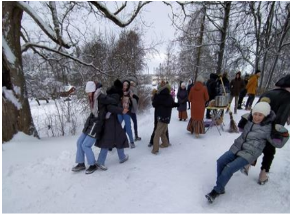
7-21. "Meten's veda Pelnu dienu"