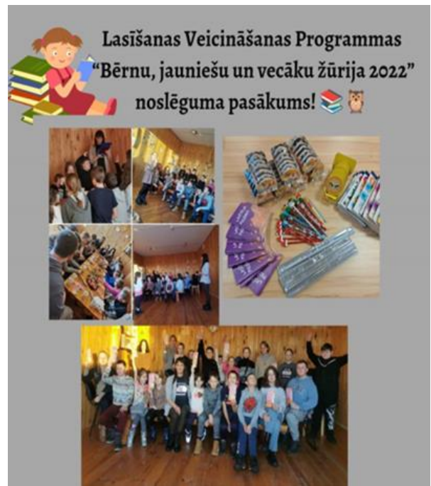
7-15. Kantinieku pagasta bibliotēkā