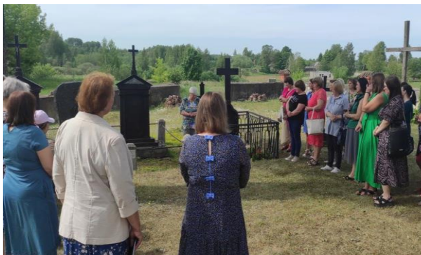
12-5. Gustava Manteifeļa atdusas vieta Dricānu baznīcas dārzā