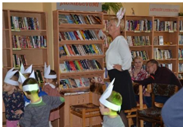
7-8. "Pūčulēnu" skola Feimaņu pagast bibliotēkā