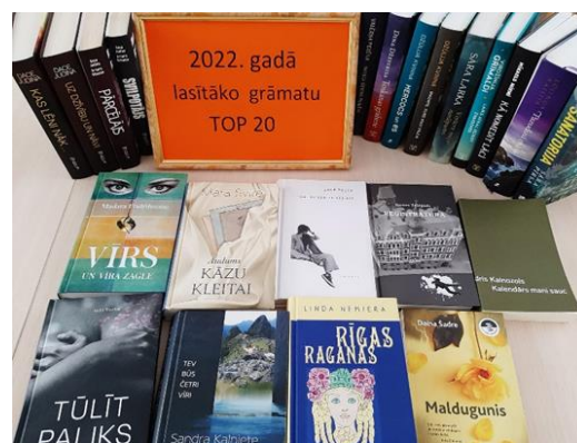
6-4. Kaunatas pagasta bibliotēkā