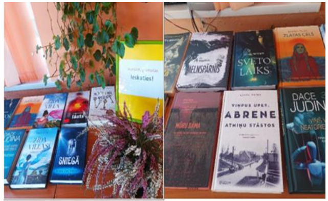
6-8. Mākoņkalna pagasta bibliotēkā