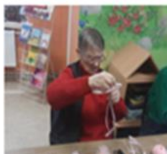
11-11. Darbnīca “Ķer mīlestības sapni!” Audriņu pagasta bibliotēkā