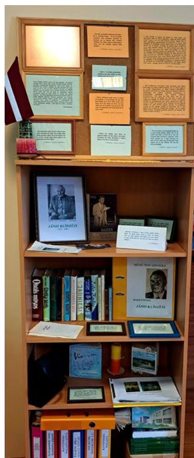
8-2. Novadpētniecības stūrītis Kantinieku pagasta bibliotēkā