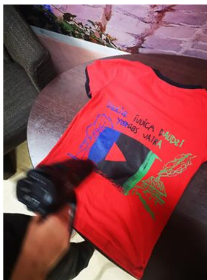
5.3 T-kreklu apdrukšanas darbnīca Ozolmuižas pagasta bibliotēkā