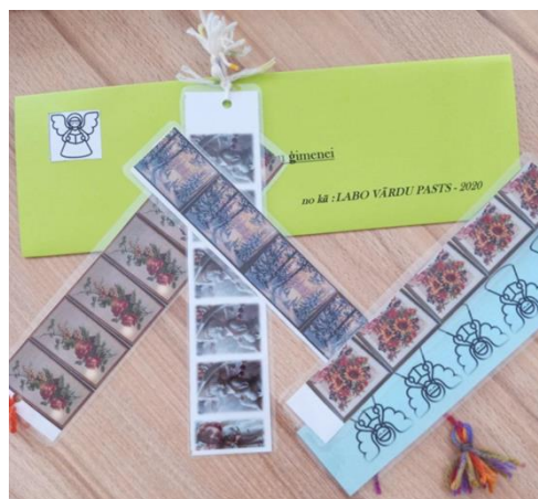
4.3 "Labo vārdu pasts" Dricānu pagasta bibliotēkā