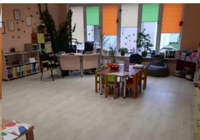
1.4 Bērnu stūrītis Kaunatas pagasta 1. bibliotēkā