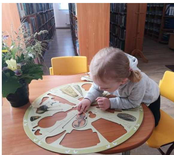
2.3 "Kamēr mamma apmaksā rēķinus" nodarbošanās pašiem mazākajiem apmeklētājiem Ozolaines pagasta bibliotēkā