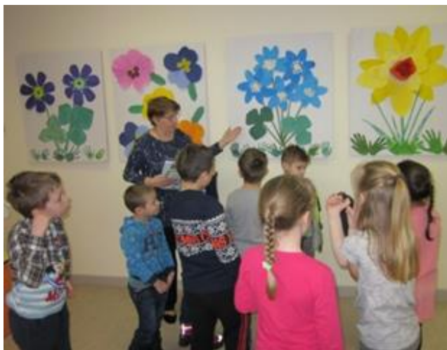
2.1 "Ceļojums ziedu valstī" Maltas pagasta bibliotēkā