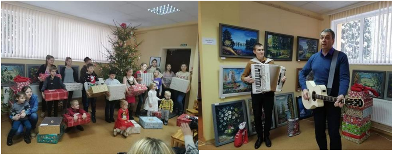
5.1 Labdarības pasākums Nautrēnu pagasta bibliotēkā