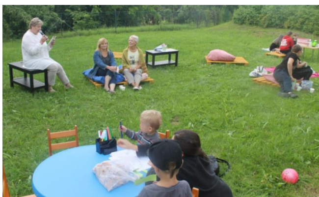
4.5 "Piknika pasakas"