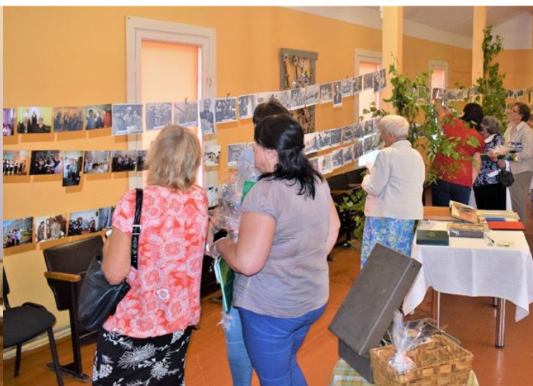
3.2 Novadpētniecības izstāde Vērēmu Tautas namā