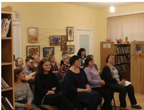
4.4 Literāri muzikāls pasākums "Sīvīte" Dricānu pagasta bibliotēkā