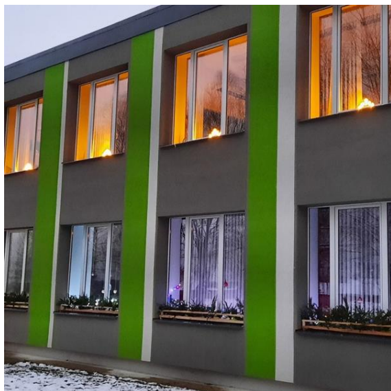
1.1.Silmalas pagasta Kruķu bibliotēkas jaunā atrašanās vieta Ziemassvētku rotā