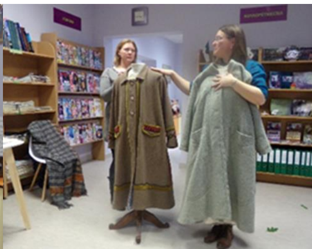
5.4 Izstāde “Tautumeitas leļļās un fotogrāfijās”, “tematisks pasākums “Ceļš uz savu tautastērpu” Maltas pagasta bibliotēkā