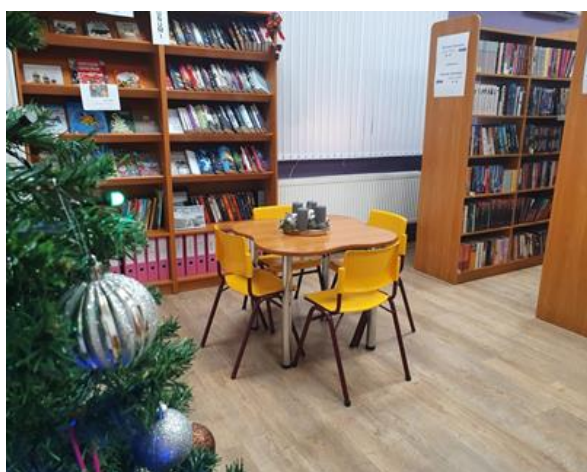
1.3 Ozolaines pagasta bibliotēkā