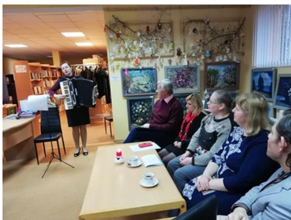
4.2 Literātu kopas "Latgales Ūdensroze" dzejnieki Nautrēnu pagasta bibliotēkā