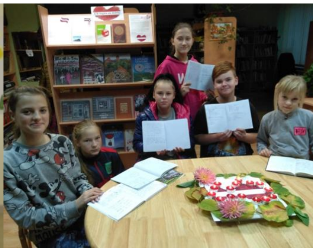
2.2 Konkursa "Dzeja Latvijai" dalībnieki Rikavas pagasta bibliotēkā