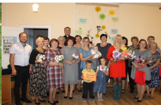
4.6 Tikšanās ar dzejnieci Inetu Atpili-Jugani