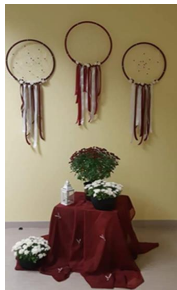
1.2. Telpu rotājums valsts svētkiem Maltas pagasta bibliotēkā