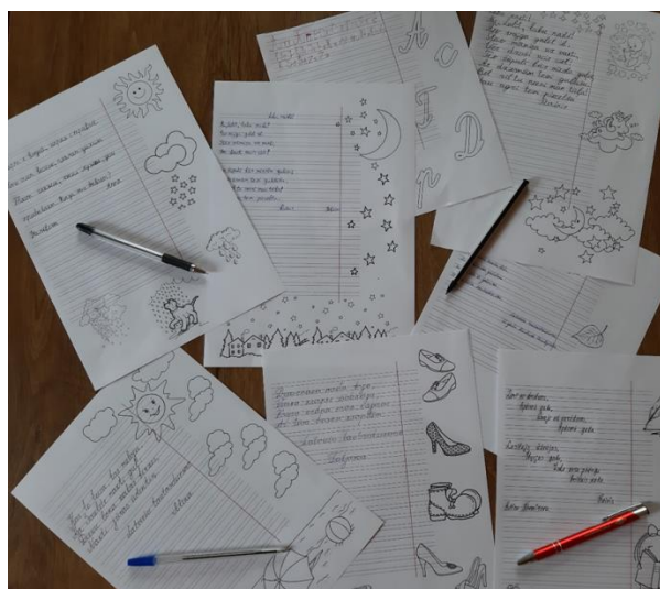
2.4 Glītraktīšanas konkursa darbi Audriņu pagasta bibliotēkā