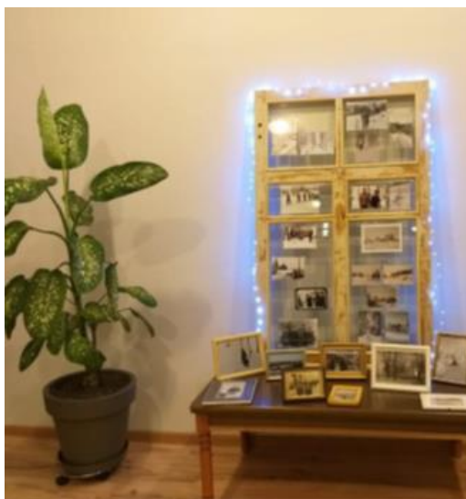
3.1. „Dricānu Ziemassvētki un Jaunais gads, ziemas ainava, ikdienas un īpaši mirkli fotogrāfijā”