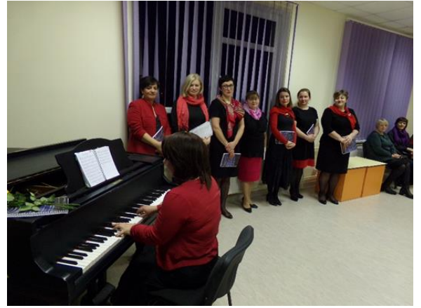
“Maltas sievietes ceļā uz Dziesmusvētkiem” – muzikālā pēcpusdiena Maltas pagasta bibliotēkā