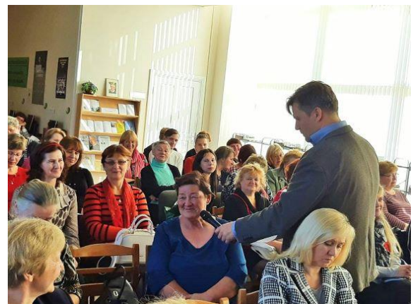
Diskusija "Dialogi par Eiropas nākotni" RGB