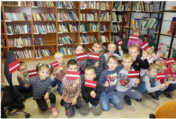
Ilzeskalna bērnu sveiceni dzimtenei lielajā jubilejā