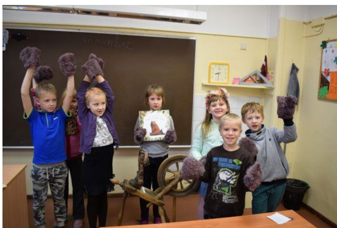
Projekts “Mūsu mazā bibliotēka” Vērēmu pagasta bibliotēkā