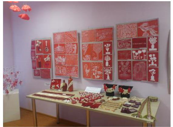
Latvijas simtgadei veltīta radošo darbu izstāde „Sarkans. Balts. Sarkans” Viļānu pilsētas bibliotēkā