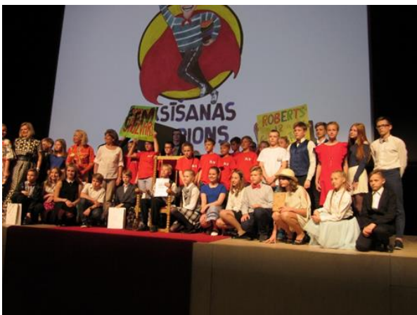
Vislatvijas Skaļās lasīšanas sacensības nacionālajā finālā LNB