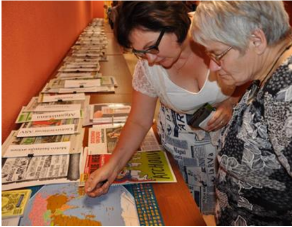
Pasaules laikrakstu izstāde Grāmatu svētkos