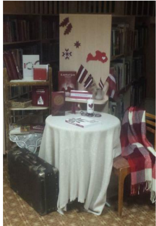
Retro fotostūrītis Latvijas simtgadei Kaunatas pagasta 1. bibliotēkā