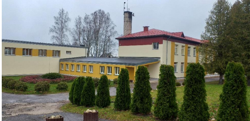
Sakstagala Jāņa Klīdzēja pamatskolas ārskats 2019. gadā

Sakstagala Jāņa Klīdzēja pamatskola izveidota 1895. gadā. Pirmajā mācību gadā skola darbojās Franča Trasuna mājā “Kolnasāta”, bet, sākot ar 1896. gadu, iekārtojās 1801. gadā celtajā Cīvkoru kroga ēkā.